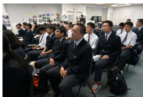
そして、原爆資料館で講話を拝聴し、平和への想いを深めました。