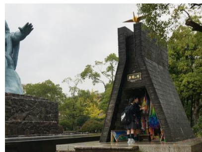
雨の長崎平和公園。2年生みんなで平和を祈りながら折った鶴を捧げました。