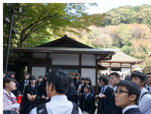
「日本史の資料集に載ってた写真と同じだ！」

清水寺を後にした2年生は、グループごとに分かれて京都市内を夜まで自主研修に励みました。翌日(4日目)は、京都の旅館を出発後、一日ずっと自主研修！家族や親戚、先輩や後輩へのおみやげを手に、みんな笑顔で大阪のホテルに戻ってきました！