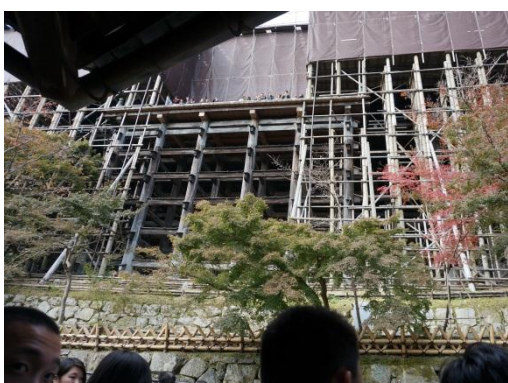
その後、京都の清水寺へ。