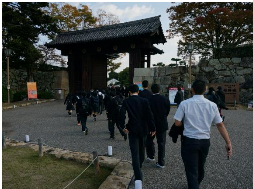
神戸港からバスに乗り、到着しました……