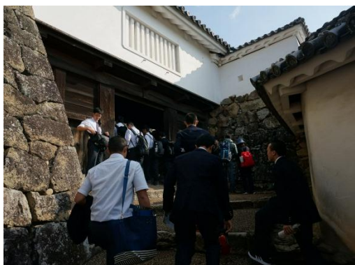
中に入ってみましょう。