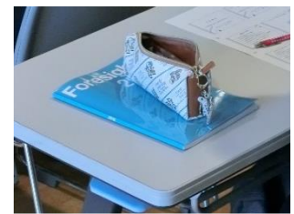
↑これが『池高手帳』です！