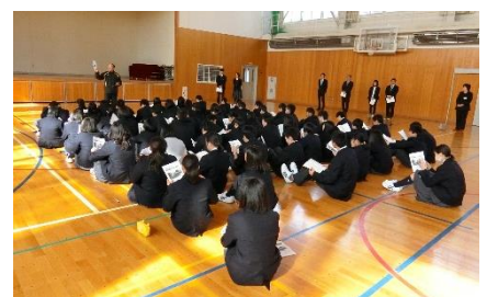
しおりを見ながら 注意点を確認しました。