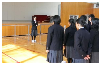
「友達をたくさん作って 楽しみましょう」 【駒さん(浦河第一中出身)】