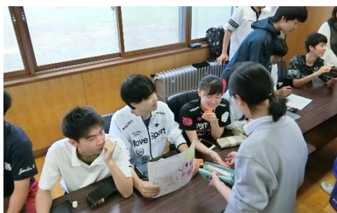
2年B組 フライドポテト……150円