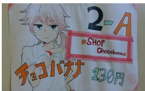
2年A組 チョコバナナ……130円