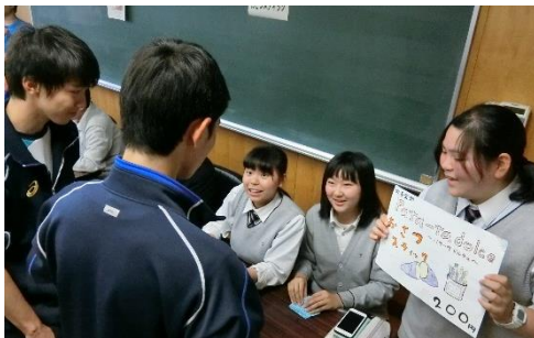
吹奏楽部 おさつスティック……200円