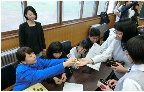
3年B組 アイスサイダー……150円