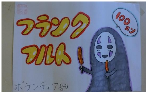
ボランティア部 フランクフルト……100円