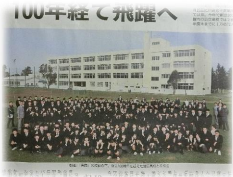
10月12日には、十勝毎日新聞に『池田高校創立100周年特集』が掲載されました。