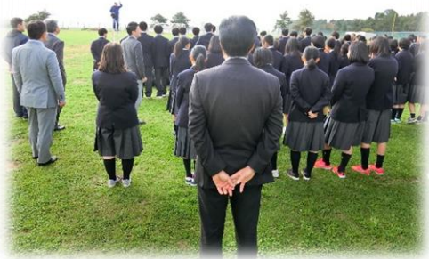
10月3日には、校舎をバックに池高生と先生方みんな揃って、記念写真撮影。