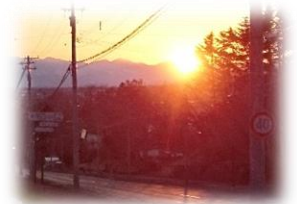
日高山脈に沈む夕日