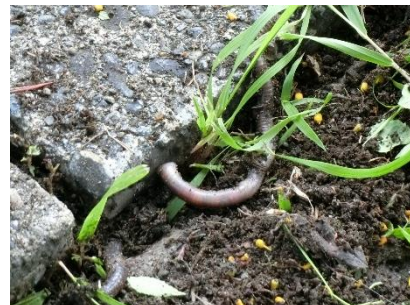
「人間さん、こんにちは♡」