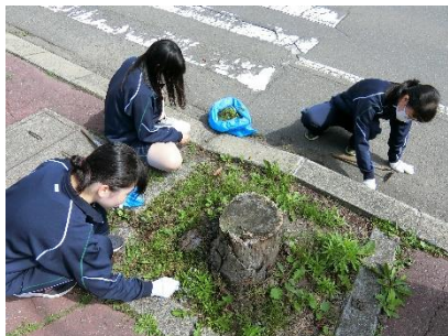
「草むしり、楽しいね♡」