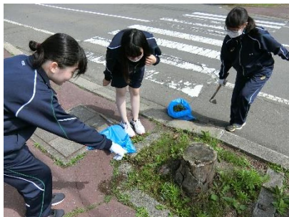
「うわー、ミミズ出てきたわ!」