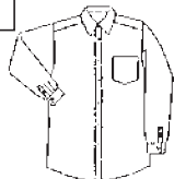
市販されているシャツのデザイン例